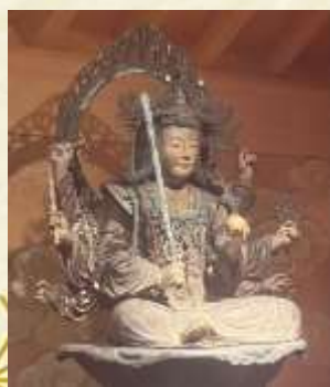
八臂弁財天 (国指定重要文化財)