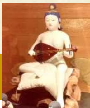
妙音弁財天 (市指定重要文化財)