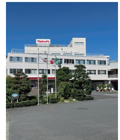
ヤクルト湘南化粧品工場