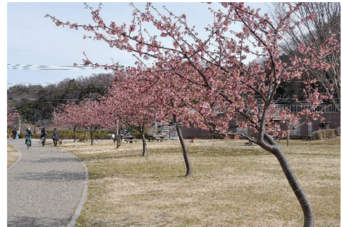
大庭親水公園の河津桜