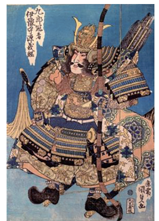
九郎冠者伊予守源義経 歌川 国貞(三代 豊国)

※天候などの理由によりイベントの一部が変更または中止になる場合があります。また、各イベントの出演者等は変更になる場合がありますので、当館のホームページをご覧ください。