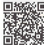
藤沢公民館 ホームページ