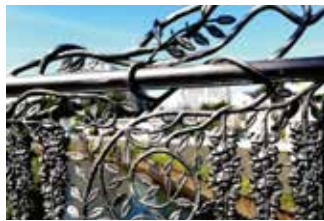
東橋から境川を望む