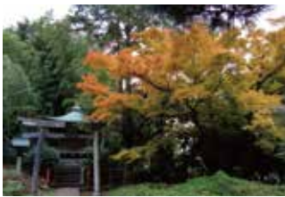
感応院・三島神社