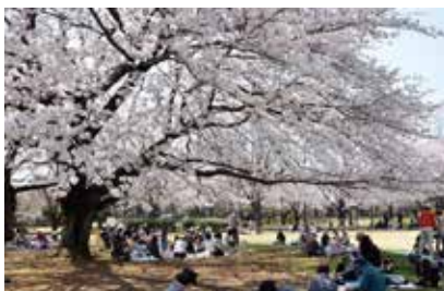
大庭城址公園の桜