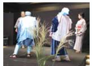
遊行かぶき(昨年の公演から)

※天候などの理由によりイベントの一部が変更または中止になる場合があります。また、各イベントの出演者等は変更になる場合がありますので当館のホームページをご覧ください。