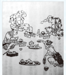
おせん(群書類従より)