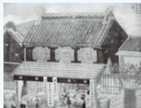
描かれた広文堂店先